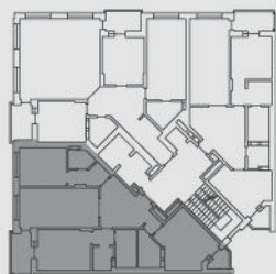
СХЕМА РОЗТАШУВАННЯ НА ПОВЕРСІ