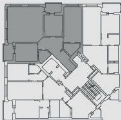
СХЕМА РОЗТАШУВАННЯ НА ПОВЕРСІ