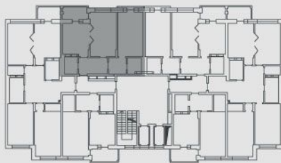
СХЕМА РОЗТАШУВАННЯ НА ПОВЕРСІ